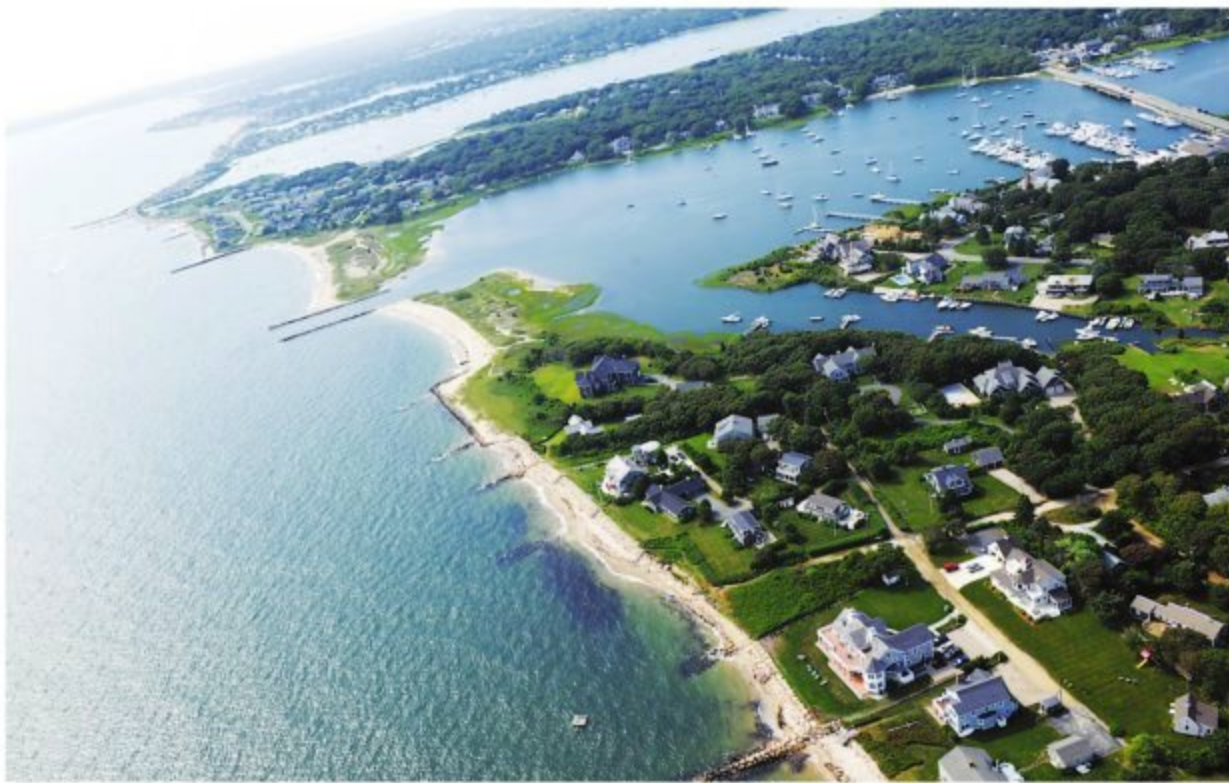
著名的度假勝地「瑪莎葡萄園」。奧巴馬總統一家曾三次在此地度假。今年夏天可能會再次成行。